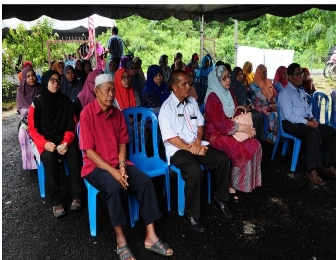
Antara penduduk Kg.Kenanga yang hadir.