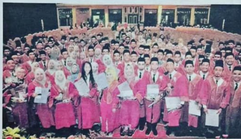
Sebahagian daripada graduan PKT yang menerima skrol diploma masing-masing pada Majlis Konvokesyen ke-17 PKT di Taman Tamadun Islam semalam.