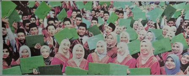
Seramai 199 pelajar politeknik Kuala Terengganu bagi sesi Jun dan Disember 2016 menerima diploma masing-masing pada Majlis Konvokesyen kali Ke-16 Institut itu, semalam.

Sebanyak 96 peratus graduan bagi sesi Jun dan Disember 2016 telah bekerja