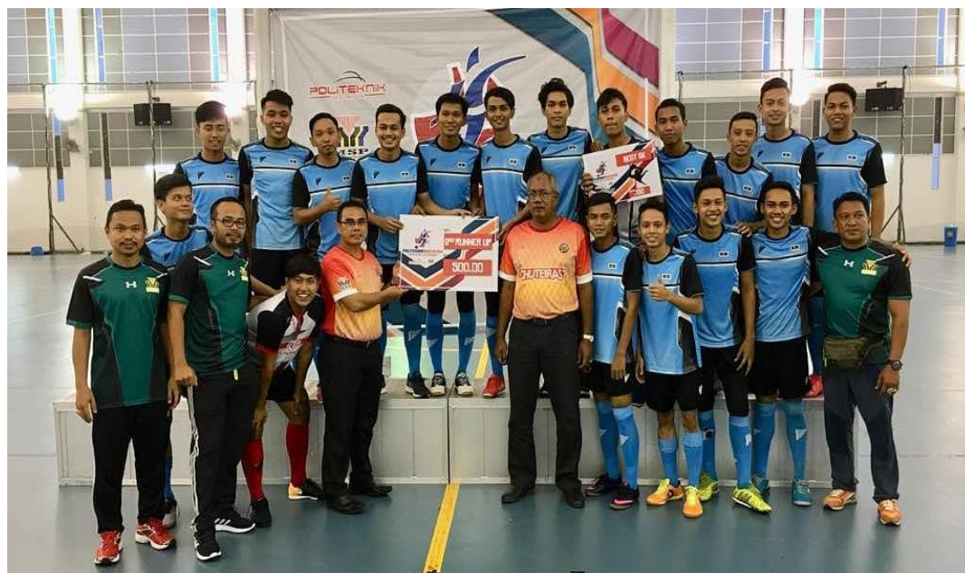
TEMPAT KE-3 Sempena Malaysia Futsal League 2018 bertempat di IIUM Kuantan