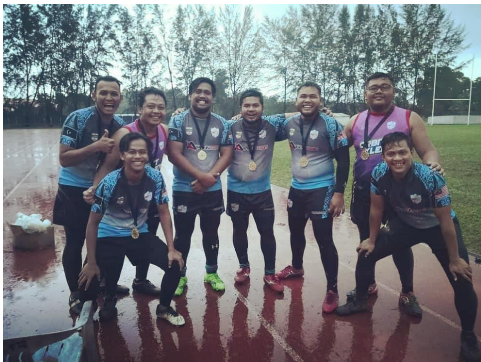
JOHAN CUP Kejohanan Rugby Liga Terengganu 15s