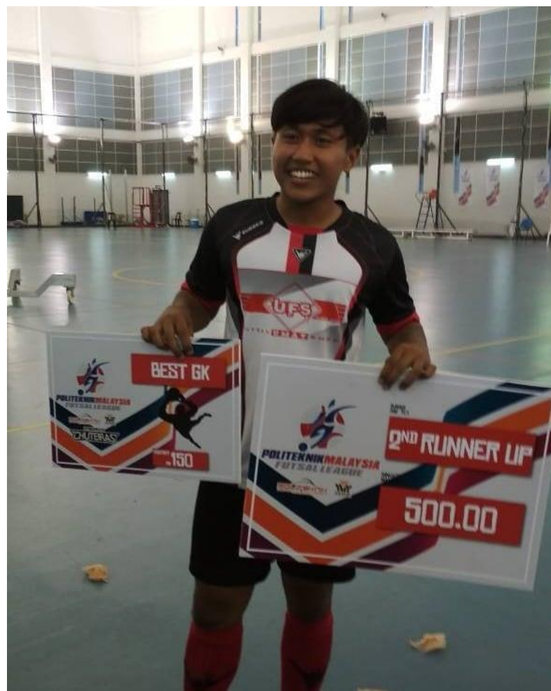
KEEPER TERBAIK SYATIR sempena Kejohanan Futsal Politeknik Malaysia bertempat di IIUM Kuantan.