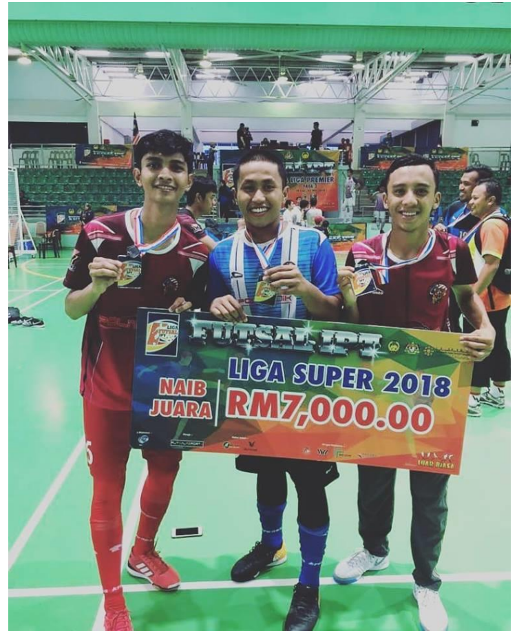
NAIB JOHAN 3 orang pelajar PKT mewakili Team Politeknik Malaysia dalam Futsal Liga IPT 2018