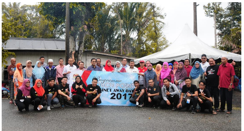
Antara sukarelawan dari PKT yang terlibat dalam Program Touch Point Cabinet Away Day 2017, PKT bersama Parlimen Marang di Kampung Kenanga.

Nama-nama peserta yang terpilih diperoleh dari Unit Penyelaras Pelaksanaan (ICU), Jabatan Perdana Menteri dan mereka ini adalah berdaftar dengan E-Kasih. Kos keseluruhan bagi fasa kedua ini menelan belanja sebanyak RM110,000.00.